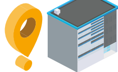
● Data Center El Poblado TIER III en Diseño, Construcción y Operación