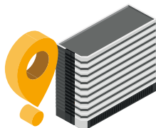
● WBP (Bogotá)