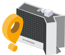
● Ed. Colseguros

Gtd Colombia cuenta con Centros de Datos distribuidos en dos de las ciudades principales del país, dos (2) en Medellín y uno (1) en Bogotá